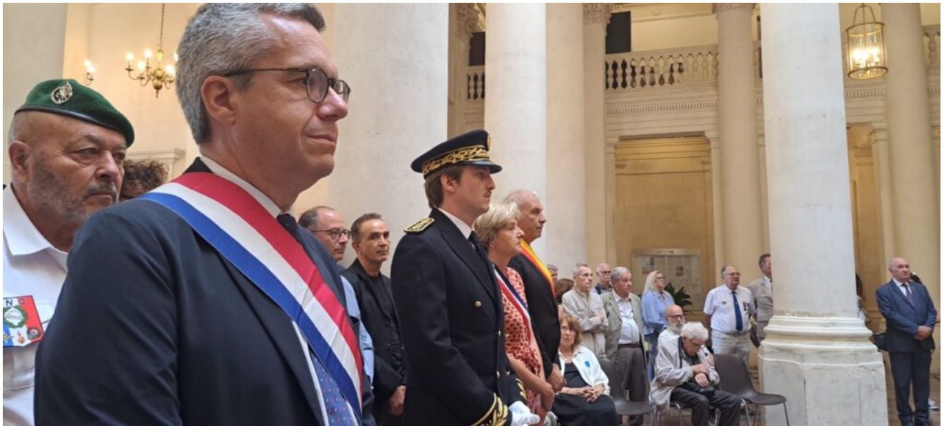
Le sénateur Jean-Baptiste Blanc et le sous-préfet Thibault de Cacqueray

Ecrit par Andrée Brunetti le 25 août 2025