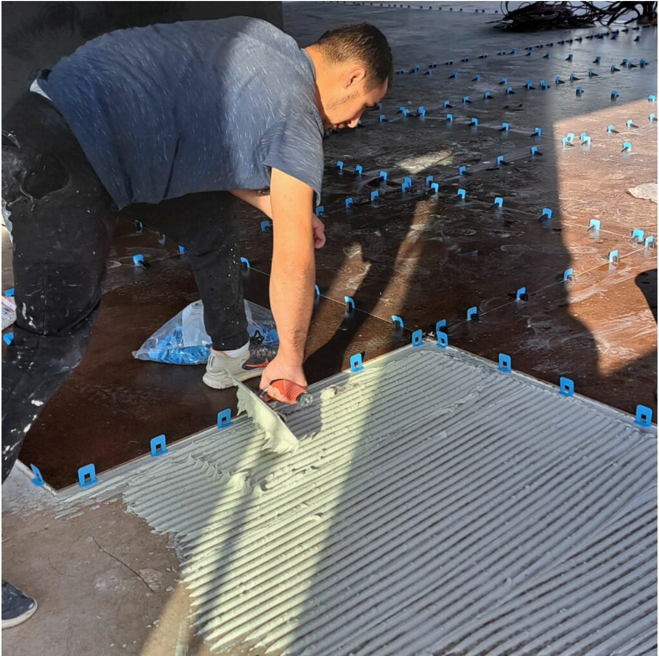
Pose du carrelage