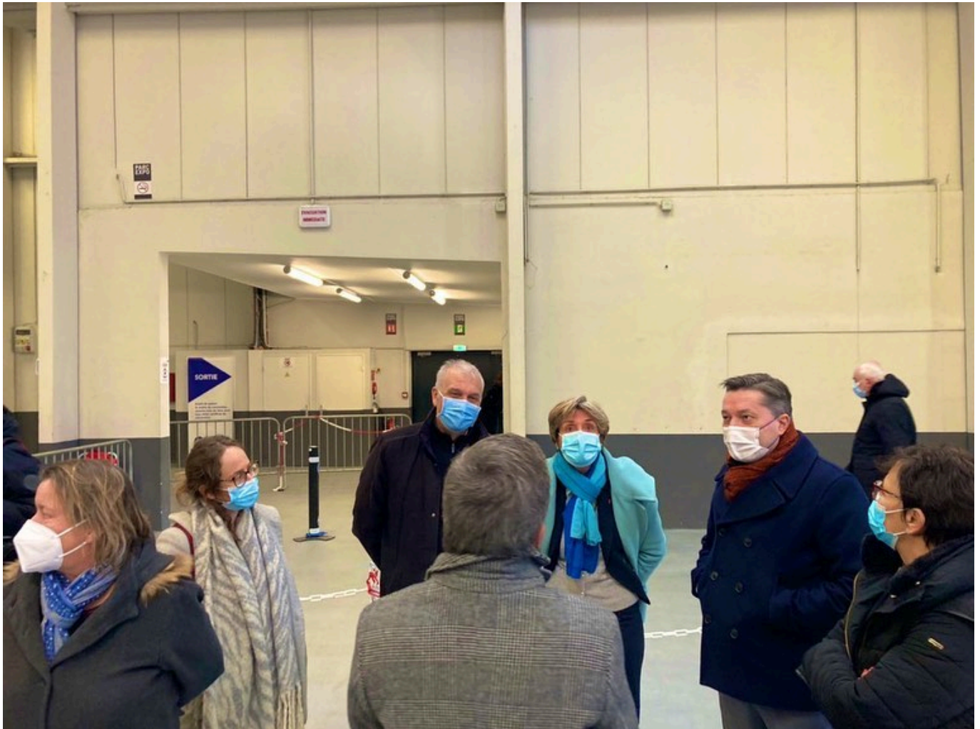
Bertrand Gaume, préfet de Vaucluse, et Cécile Helle, maire d'Avignon, au centre de vaccination départemental de Vaucluse.

Lire aussi : Vaccination : le Vaucluse passe à la vitesse supérieure