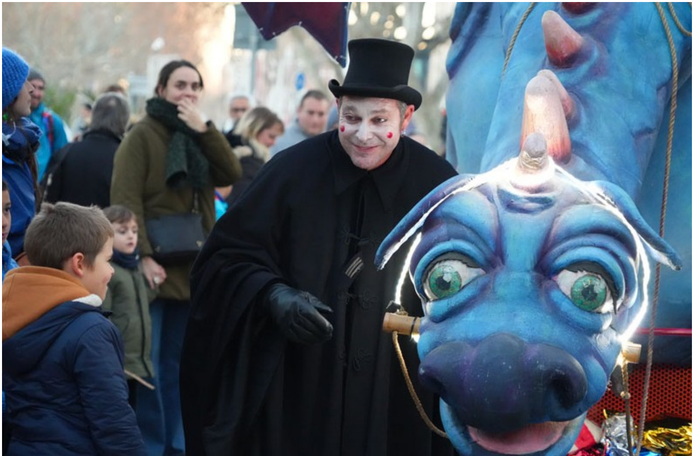
Déambulations dans la rue, La balade de Léon