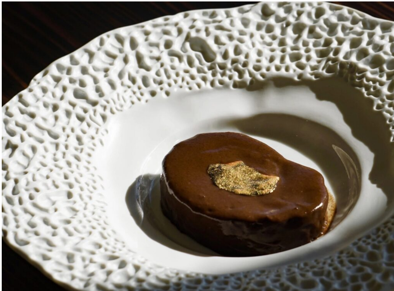
Lièvre à la royale.

à l'ail noir et en dessert une « Création amoureuse autour des agrumes et de chocolat. »