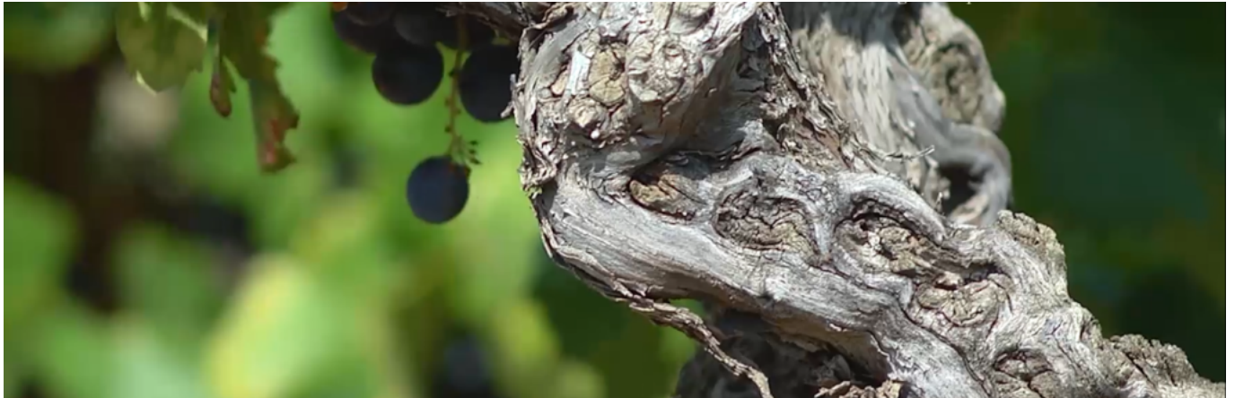
Pied de vigne