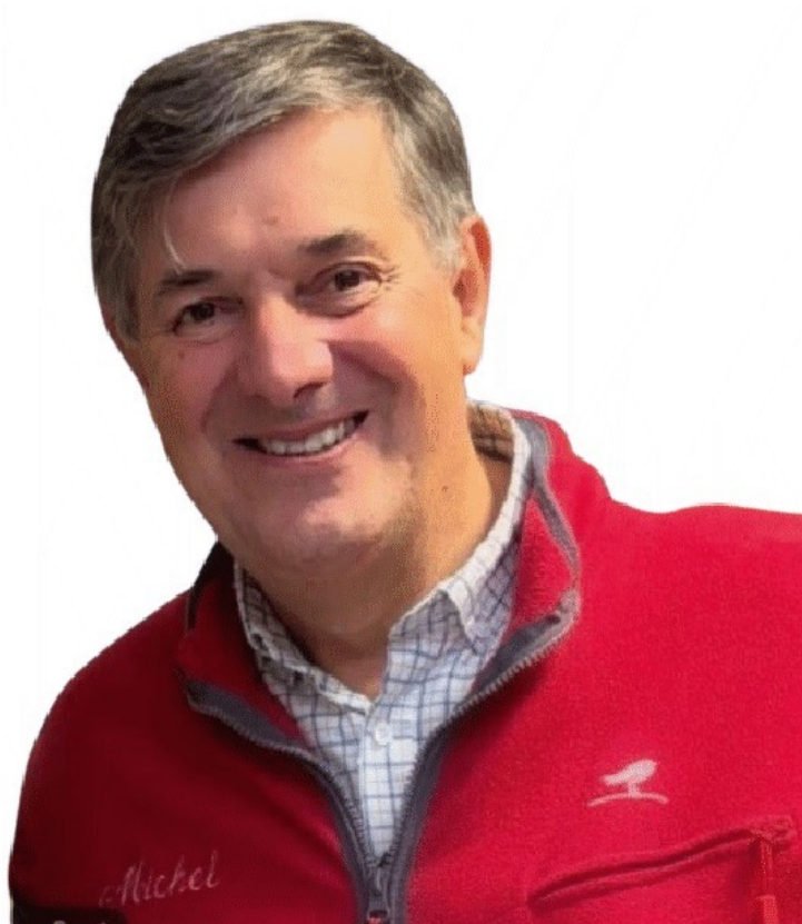
Michel de Sainte Preuve. DR

Ecrit par Andrée Brunetti le 9 janvier 2026