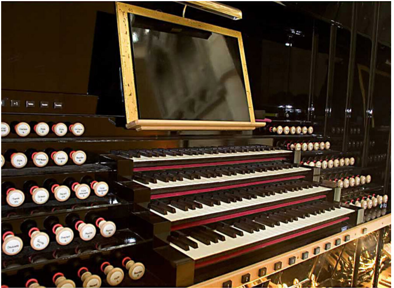
Console de l'orgue d'Evreux