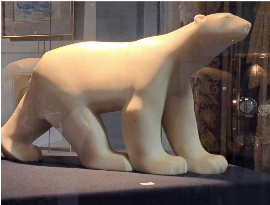
Ours Blanc de François Pompon