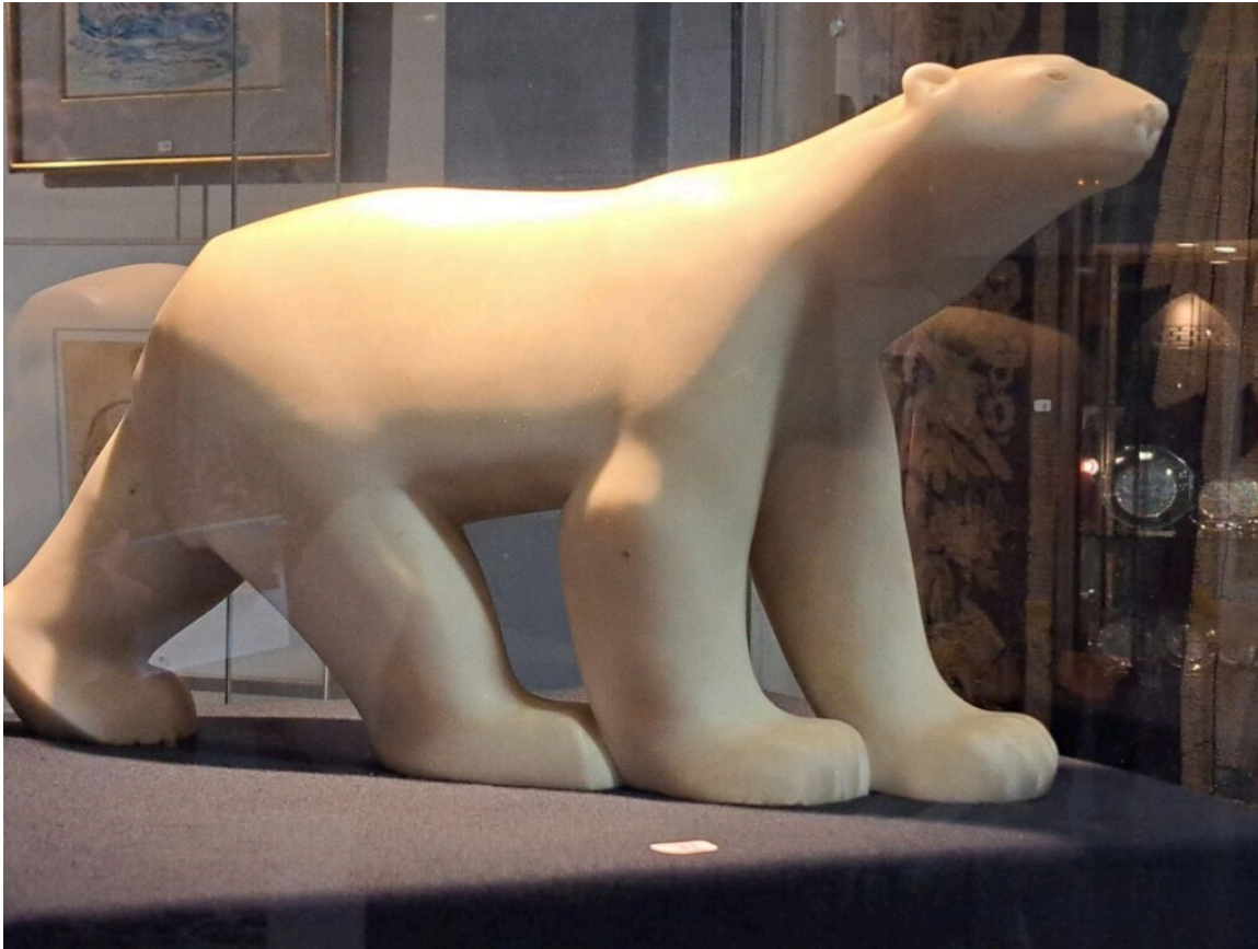
Ours Blanc de François Pompon

Ecrit par Andrée Brunetti le 1 décembre 2023