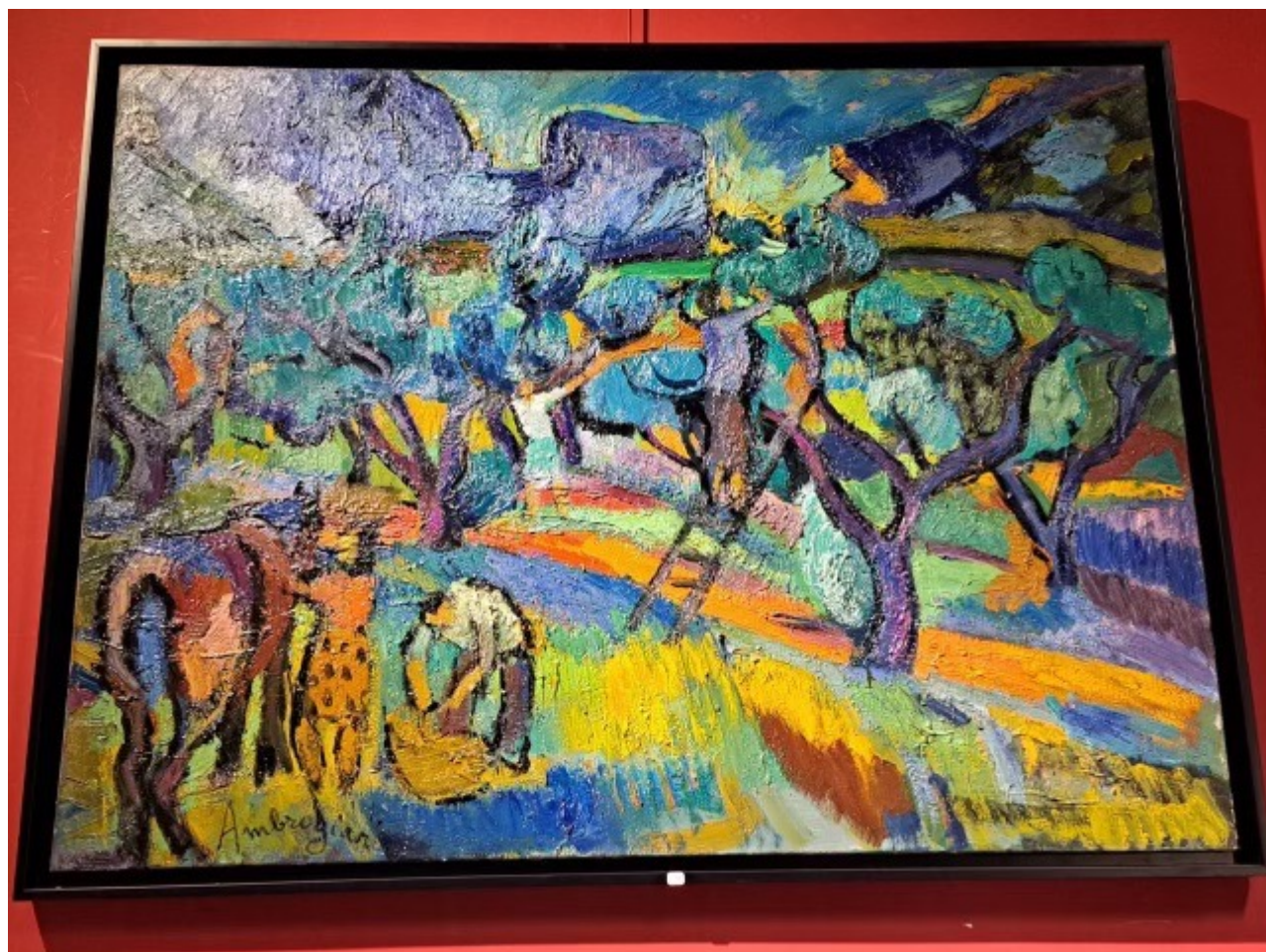
Œuvre de Pierre Ambrogiani

Ecrit par Andrée Brunetti le 1 décembre 2023