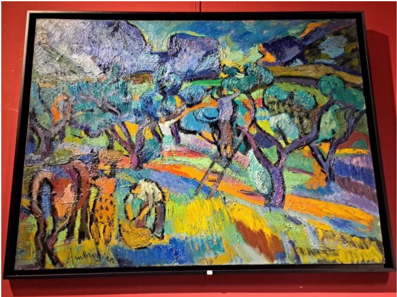
Œuvre de Pierre Ambrogiani

Ecrit par Andrée Brunetti le 1 décembre 2023