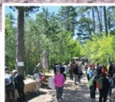
Forêt en fête à Bédoin