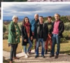
Secouristes de la faune sauvage