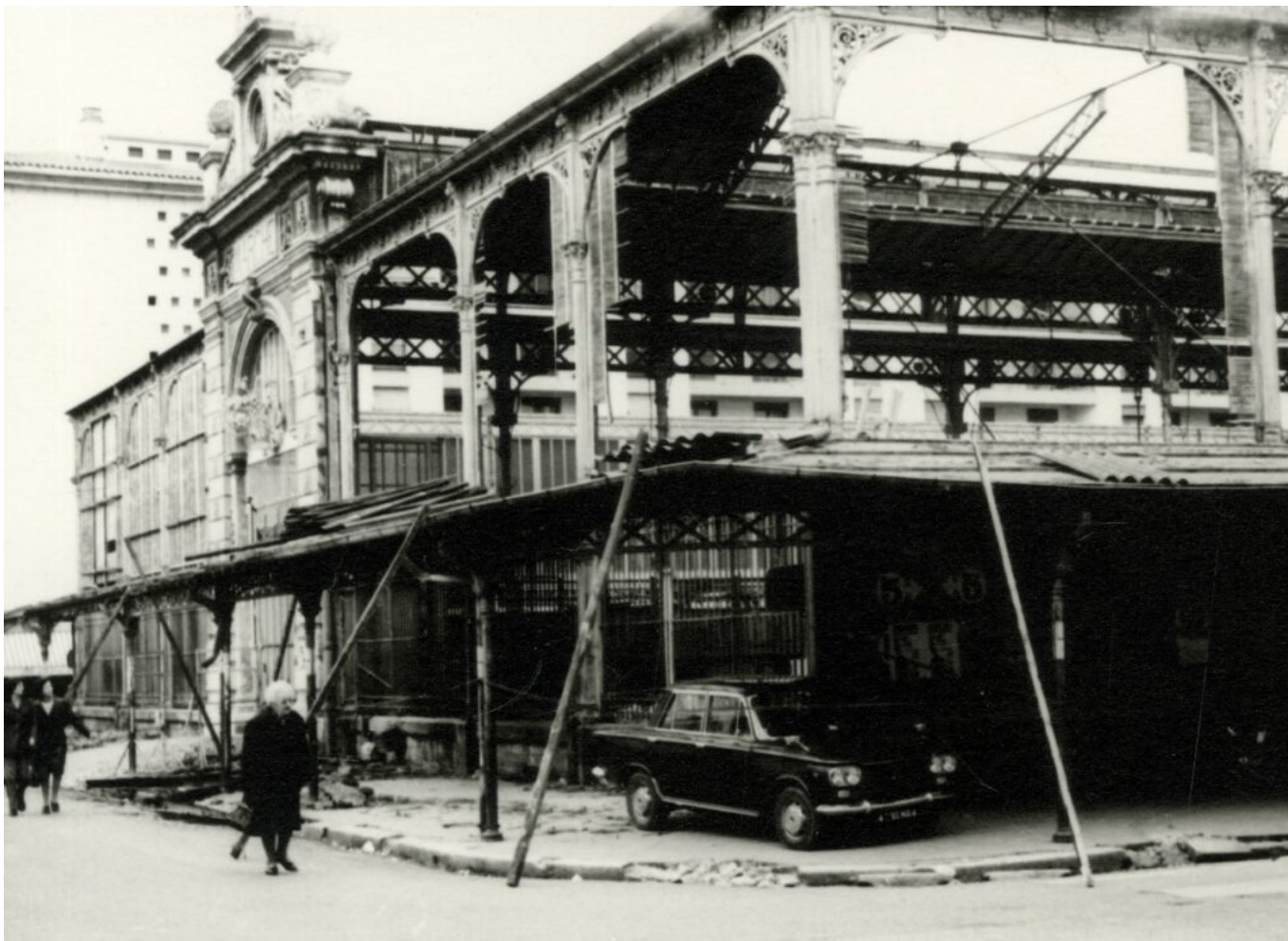
Les Halles en cours de démolition en 1972. Fond privé. Archives municipales. Anonyme. Photographie, 13X18

Ecrit par Andrée Brunetti le 1 octobre 2024