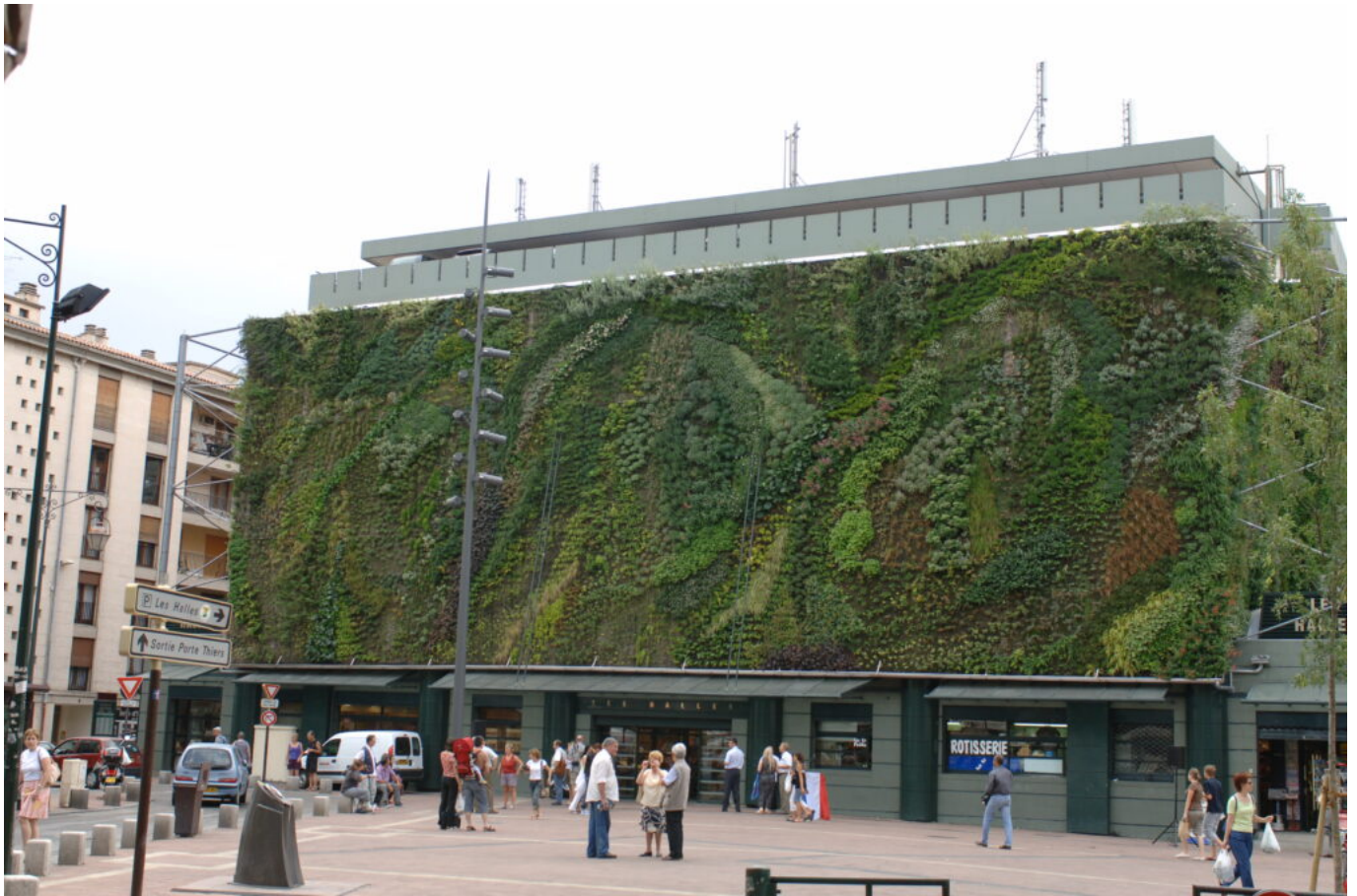
Inauguration du mur végétal des halles le 17 juin 2006.

Ecrit par Andrée Brunetti le 1 octobre 2024