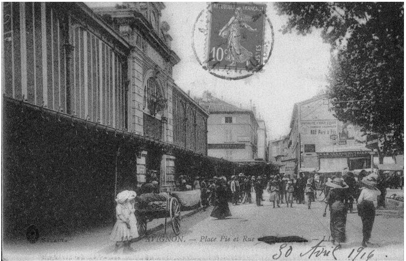
Les Halles en 1914.