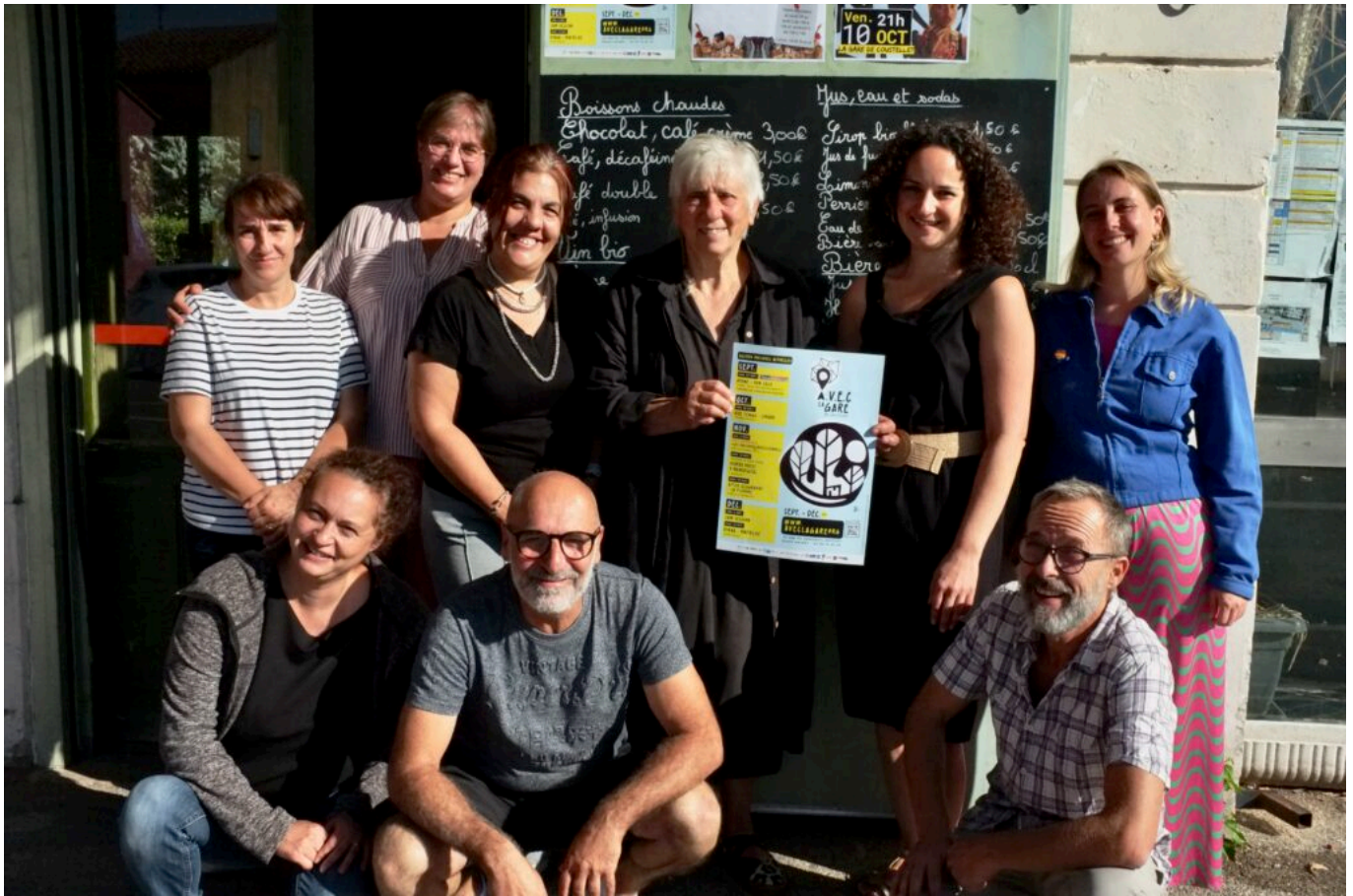
Equipe de la Gare de Coustellet

Ecrit par Didier Bailleux le 21 janvier 2026