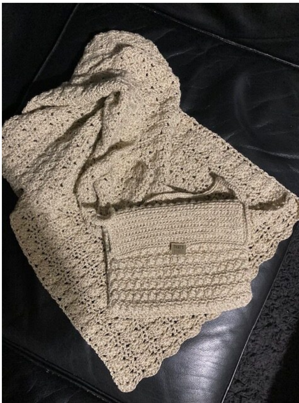
Sac et étole réalisés au crochet