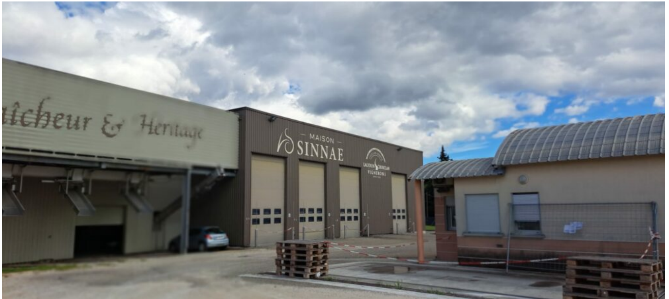
Le chai et la chaîne d'embouteillage

ateliers de dégustation et des séminaires d'associations ou d'entreprises, des soirées festives.