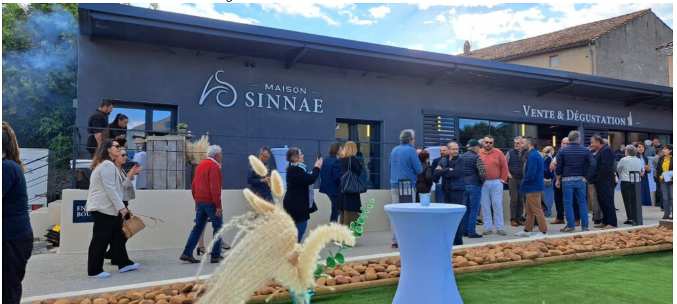
Le caveau et le pôle de réception