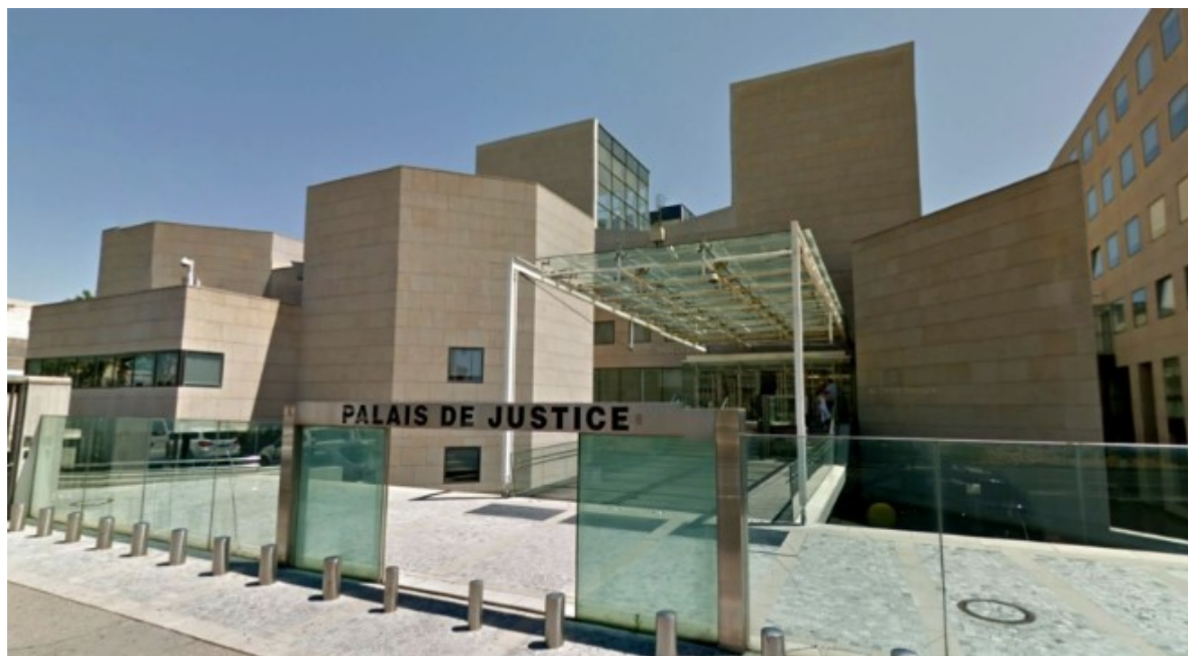
Palais de Justice d'Avignon

Ecrit par Mireille Hurlin le 14 février 2023