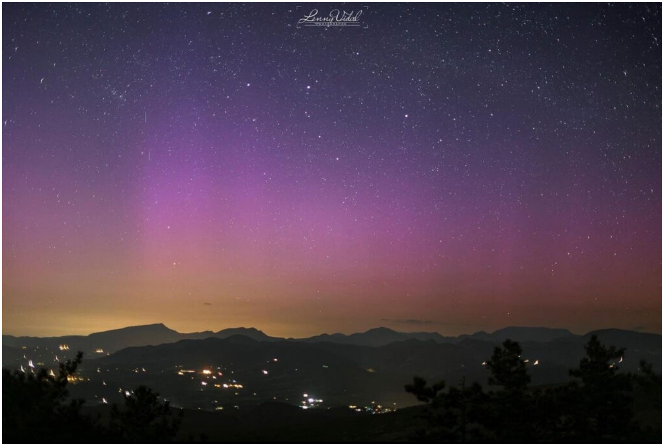
Photo prise par le photographe Lenny Vidal dans la nuit du samedi 11 au dimanche 12 mai. ©Lenny Vidal

Ecrit par Vanessa Arnal-Laugier le 12 mai 2024