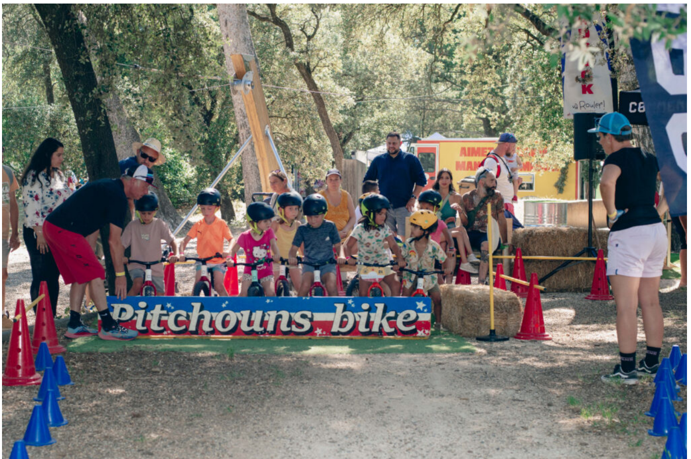
Course des "pitchouns" en draisienne.

Dès l'entrée, pour vous déplacer au milieu des 4 hectares à l'abri du soleil grâce aux arbres, on vous remettait un plan avec la Ferme pédagogique, le Village des pitchouns, l'Espace élevage, l'Atelier de démonstrations culinaires, le stand des Côtes-du-Rhône avec les Compagnons. Les visiteurs avaient le choix entre le Rucher des Marjoraines et son miel, les Chouchoux du Ventoux, les Croquants de Velleron, les Fruits de Campredon, la Confrérie du Taste-Fougasse et le stand de l'AOP Cerises de France. Côté Salon des Vins et Spiritueux, 25 exposants, dont La distillerie « Les chineurs de Malt » du Thor, le Domaine de la Camarette de Pernes-les-Fontaines, la Cave Clauvallis de Saint-Didier, le Domaine Les Hautes Briguières de Mormoiron.