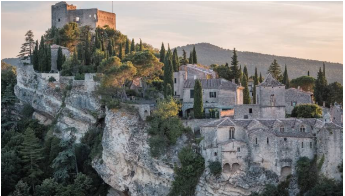
Vaison la Romaine

Ecrit par Mireille Hurlin le 19 octobre 2023