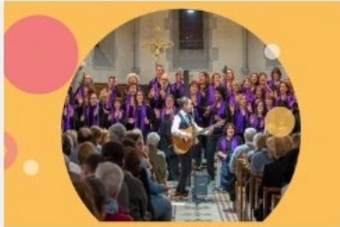
Avignon Gospel Time