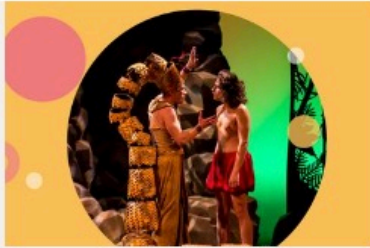
Le livre de la jungle

Ecrit par Andrée Brunetti le 11 septembre 2023