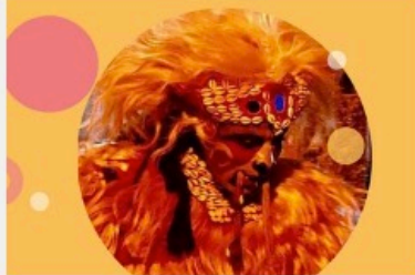
Le faux lion de Saint-Louis du Sénégal