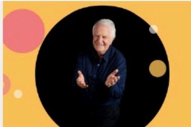
Sens Dessus Dessous