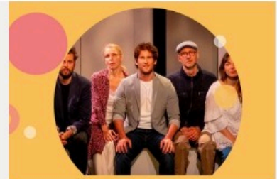
La vie est une fête