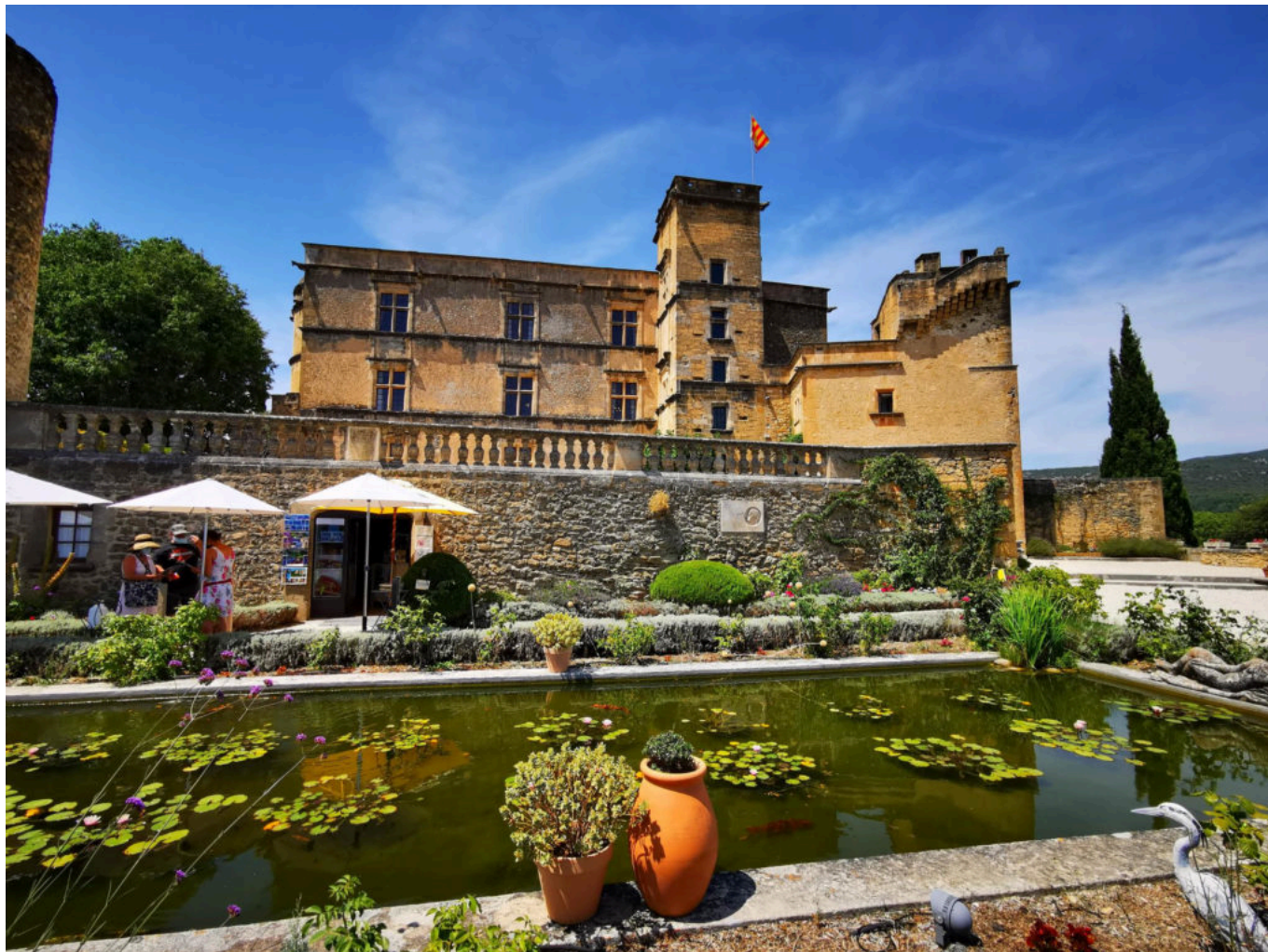
Château de Lourmarin.

guidées sont proposées pour découvrir ce bel ensemble, muni d'un carnet d'explications.