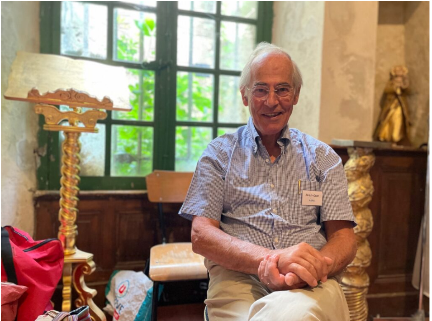
Jean-Luc Mouly Copyright MMH

Ecrit par Mireille Hurlin le 19 septembre 2025