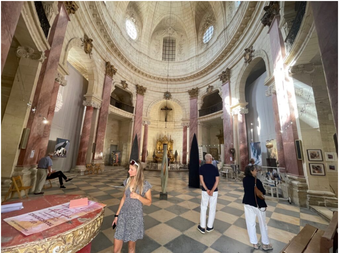
La Chapelle de l'Oratoire

Ecrit par Mireille Hurlin le 19 septembre 2025