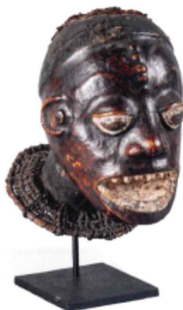
MASQUE EKOÏ, EJAGHAM, NIGERIA. Cimier surmonté d'une coiffe. Bois à patine brune, cuir et pigments. Haut : 28 cm. 500/700 €