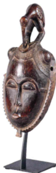
MASQUE YAHOURE, CÔTE D'IVOIRE surmonté d'une coiffure représentant un oiseau en ronde-bosse. Bois à patine brune nuancée rouge, pièce de monnaie. Haut : 36 cm. 3000/4000 €