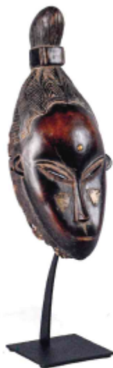
MASQUE GOURO, CÔTE D'IVOIRE représentant le portrait d'une jeune fille de la communauté Gouro réputée pour sa beauté. Bois à patine brune, alliage de cuivre. Haut : 35 cm. 2000/3000 €

Ecrit par Mireille Hurlin le 2 février 2024