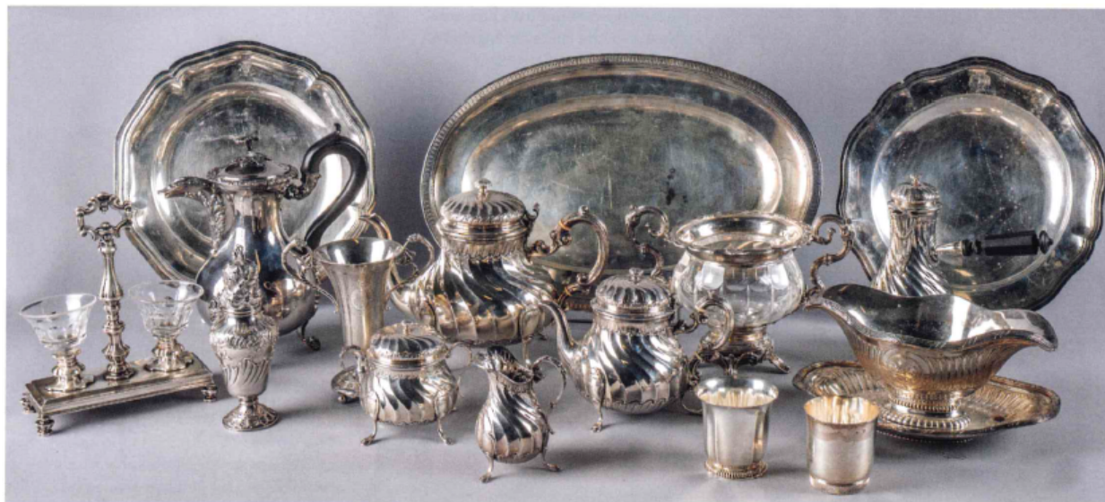
D'UN ENSEMBLE DE PIÈCES D'ORFÈVRE dont plats et pièces de forme en argent. Epoques XIXe et XXe.

Ecrit par Mireille Hurlin le 2 février 2024