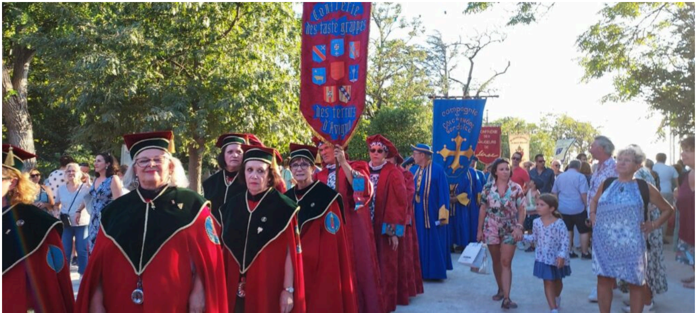
Défilé des confréries bachiques

Ecrit par Andrée Brunetti le 21 août 2023