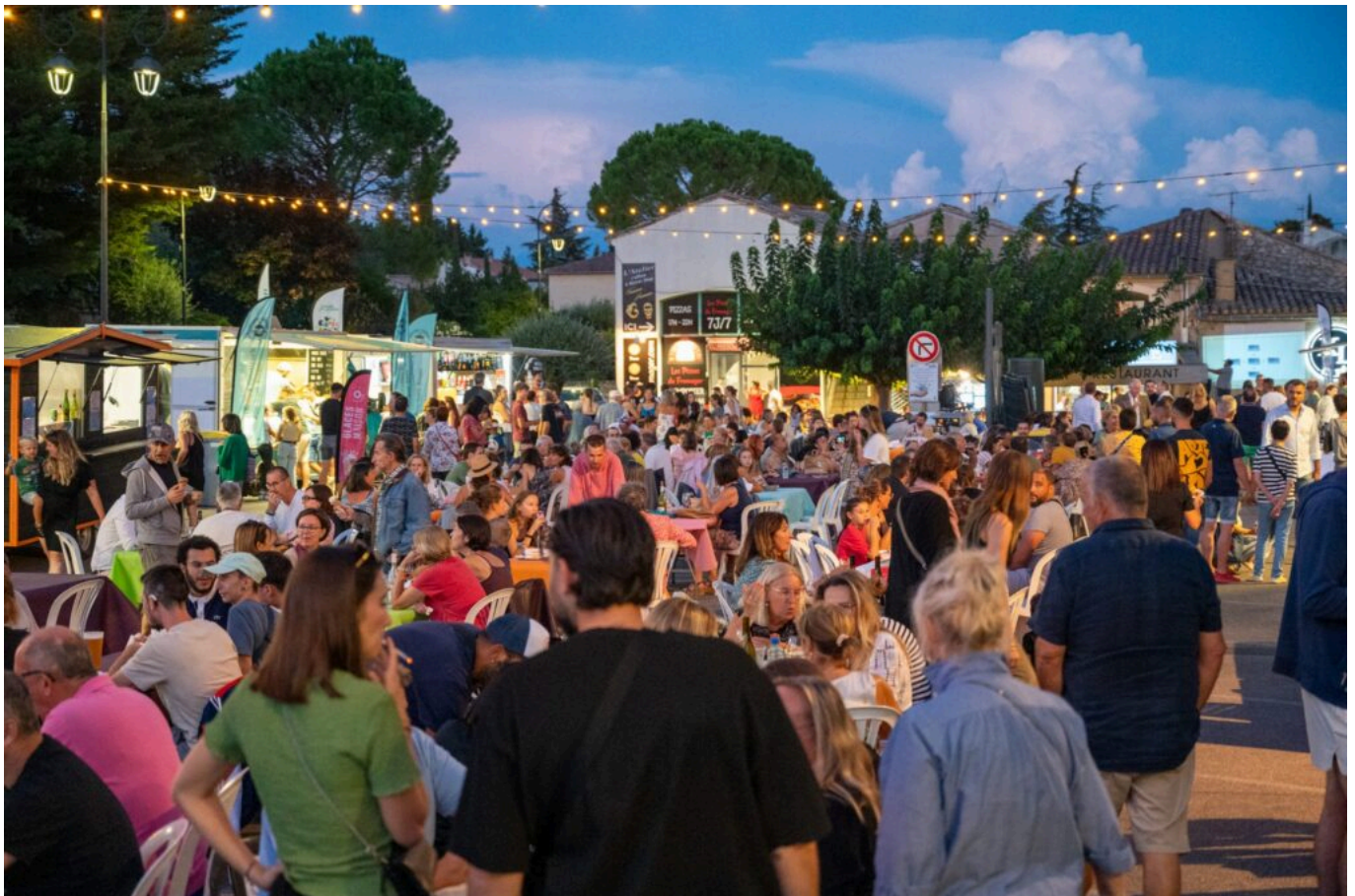
La soirée des Défis Foodtruck.