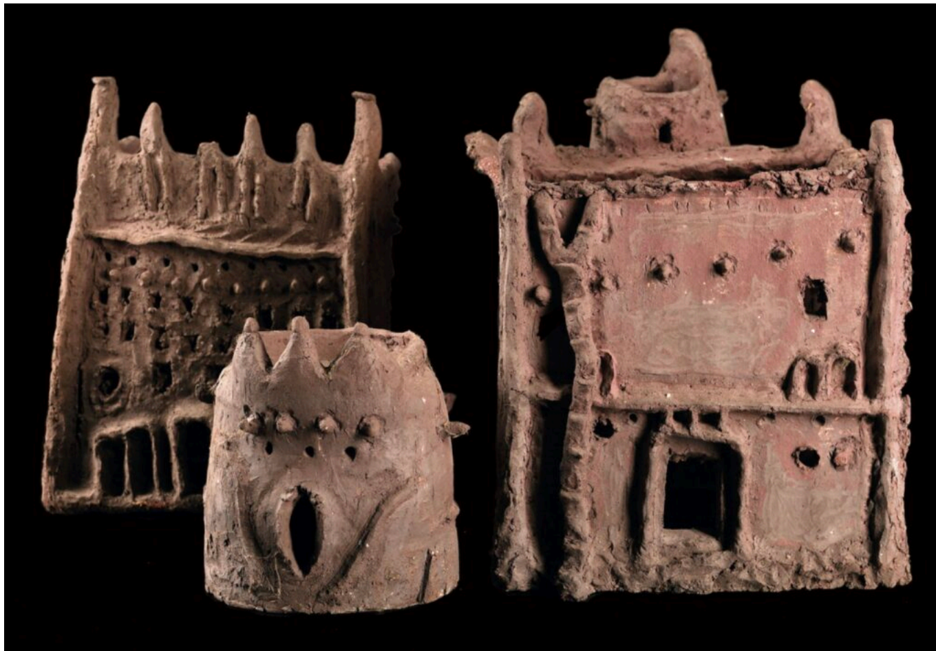
Oeuvre de Amahiguere Dolo. Prêt de la fondation Blachère

humaines et les liens invisibles, spirituels, qui unissent les êtres à leur territoire.