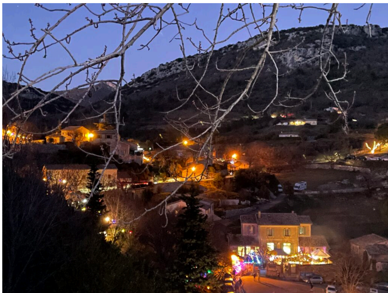
Brantes dans les étoiles, l'école du village, copyright Mireille Hurlin

Brantes, le petit village provençal typique à 600 m d'altitude, bastion des ligures -population pré-néolithique- et bien après des protestants lors des guerres de religion, doit avoir une côte irrésistible ? «C'est même le drame ! Reprend Pascale Lagarde. L'immobilier ne cessant de grimper, les enfants du pays ne peuvent plus s'y installer pour y vivre à l'année. La conclusion ? C'est très chic d'habiter à Brantes et encore plus chic d'y être entrepreneur,» sourit Pascale Lagarde.