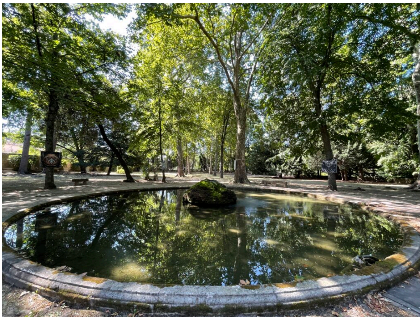
L'une des deux fontaines rocaille du Parc et ses arbres remarquables

Ecrit par Mireille Hurlin le 29 août 2024