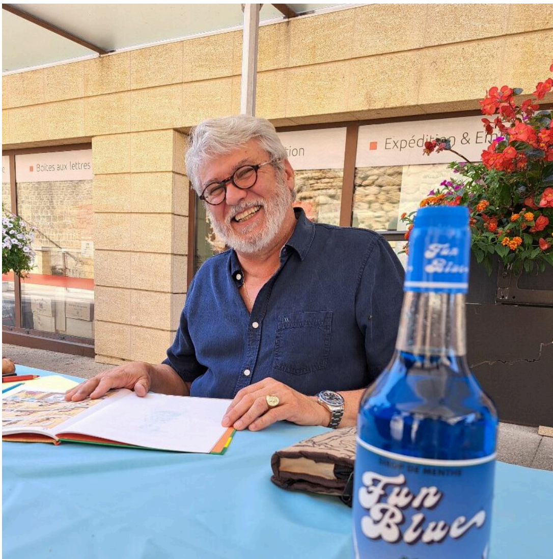
Achdé, alias Hervé Darmenton, l'auteur de Lucky Luke depuis 2001.

« A l'époque, c'étaient des super héros », explique Raphaël Vannelle, « Des « comics » américains. Puis ce sont surtout des dessinateurs belges et français qui se sont imposés et j'ai acheté leurs albums, évolué avec eux, enrichi ma collection. Aujourd'hui j'en ai environ 3 000 oeuvres dans ma bibliothèque. Il faut savoir et que c'est devenu un vrai marché dans le monde. Ce n'est pas un art mineur, c'est un art à part entière. Comme j'adore Hugo Pratt, je suis allé en Italie pour acheter une de ses planches originale de « Corto Maltese ». Je suis capable de filer jusqu'aux Etats-Unis, en Espagne pour dénicher l'objet rare. Hergé est côté 500 000€ minimum. En BD, les prix partent de 5 000€ pour atteindre des sommets, comme en peinture. Un 'Batman' de Frank Miller, par exemple, a été adjugé 3,2M€ à New-York ».