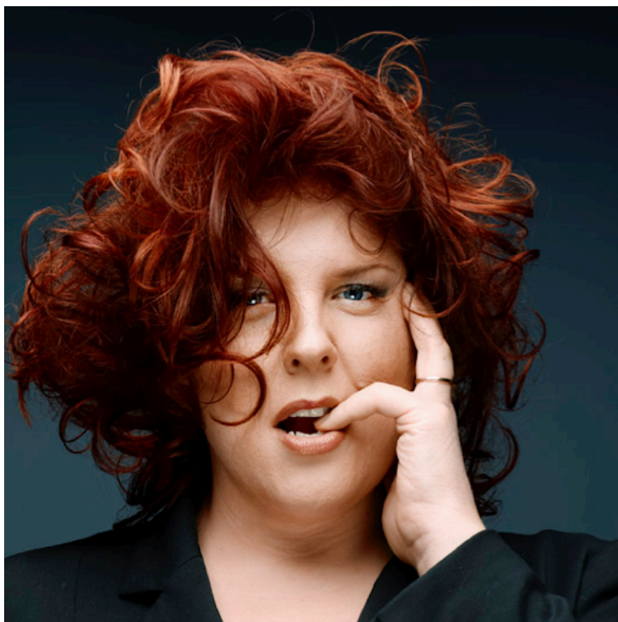
Marie-Nicole Lemieux.