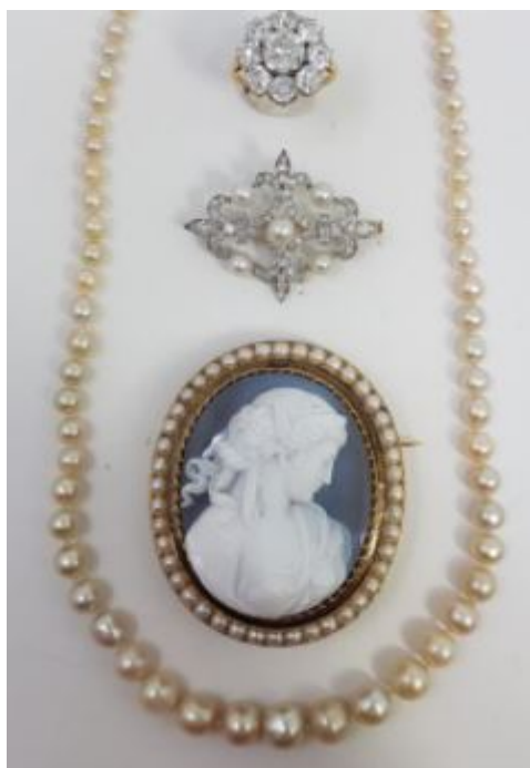
Collier de 94 perles fines

Attention, l'Hôtel des ventes est fermé du 7 au 31 août.