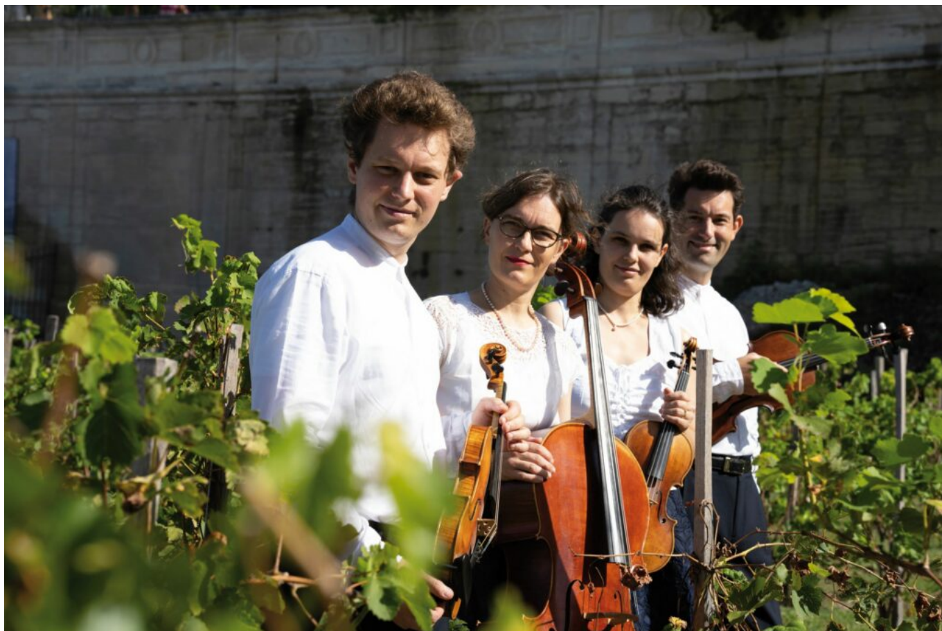
Le quatuor Girard.