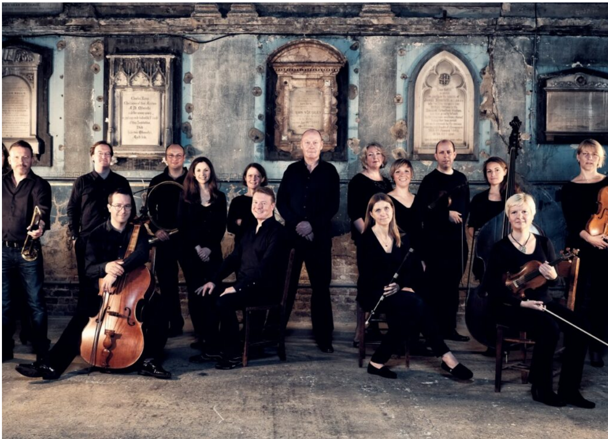
“King Arthur” par le Gabrieli Consort le 09 juillet place de l'Horloge à Ménérbes

A Ménérbes le 9 juillet, mais en plein air sur la Place de l'Horloge l'opéra « King Arthur » de Purcell qui sera dirigé par le londonien Paul Mac Creesh à la tête de son Ensemble Gabrieli Consort & Players et de sopranos, ténors baryton et baryton-basse réputés.