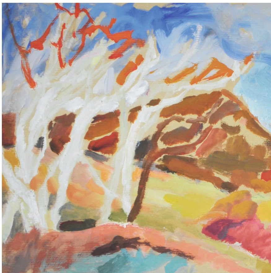
Une des peintures exposés à Crillon-le-Brave.

Ecrit par Echo du Mardi le 29 juillet 2022