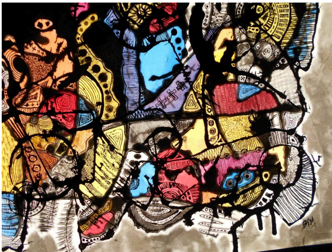
L'une des œuvres exposés à Venasque.

Ecrit par Echo du Mardi le 29 juillet 2022