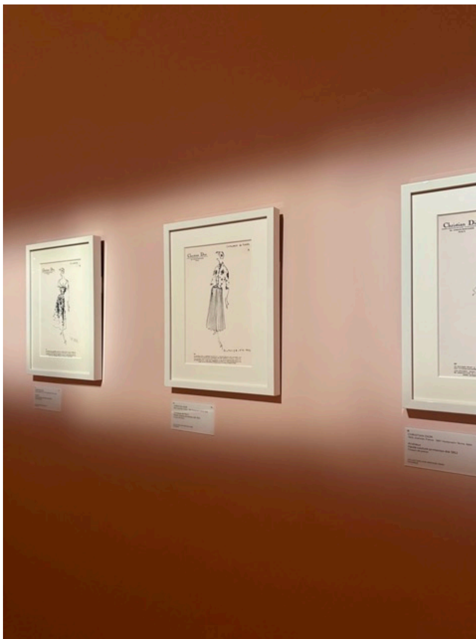
Des croquis de Christian Dior