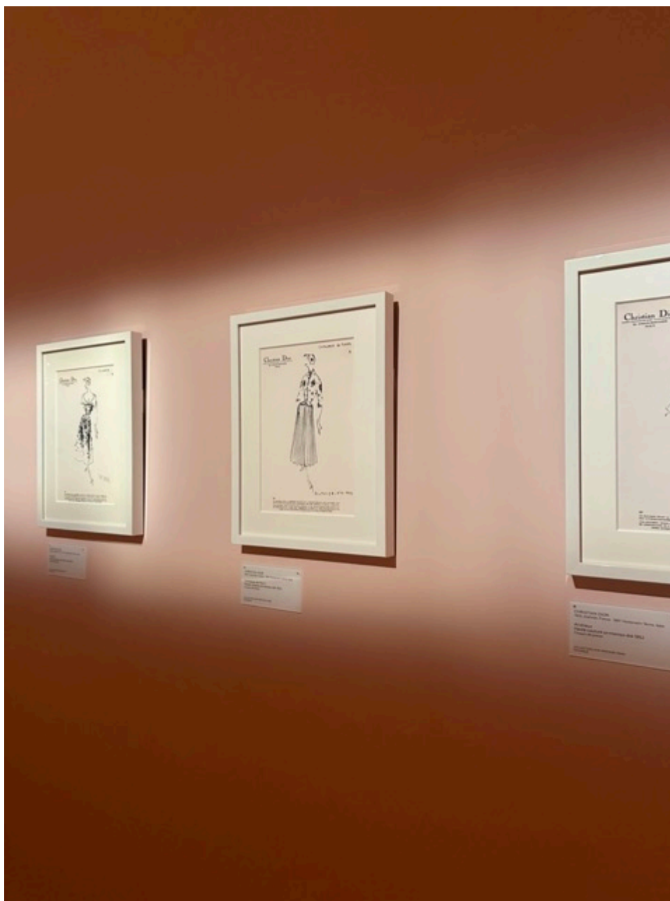
Des croquis de Christian Dior