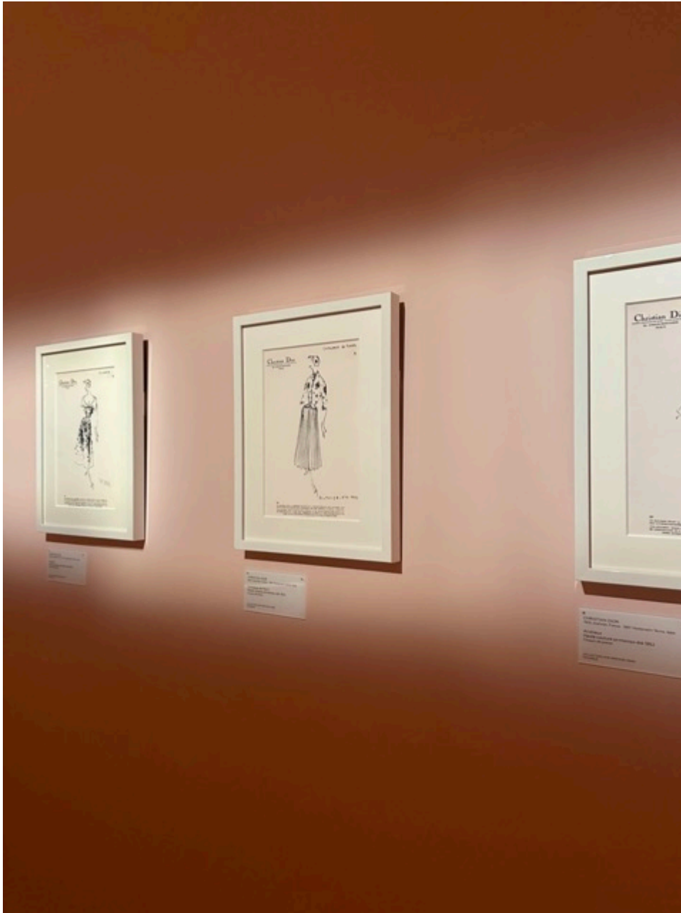
Des croquis de Christian Dior