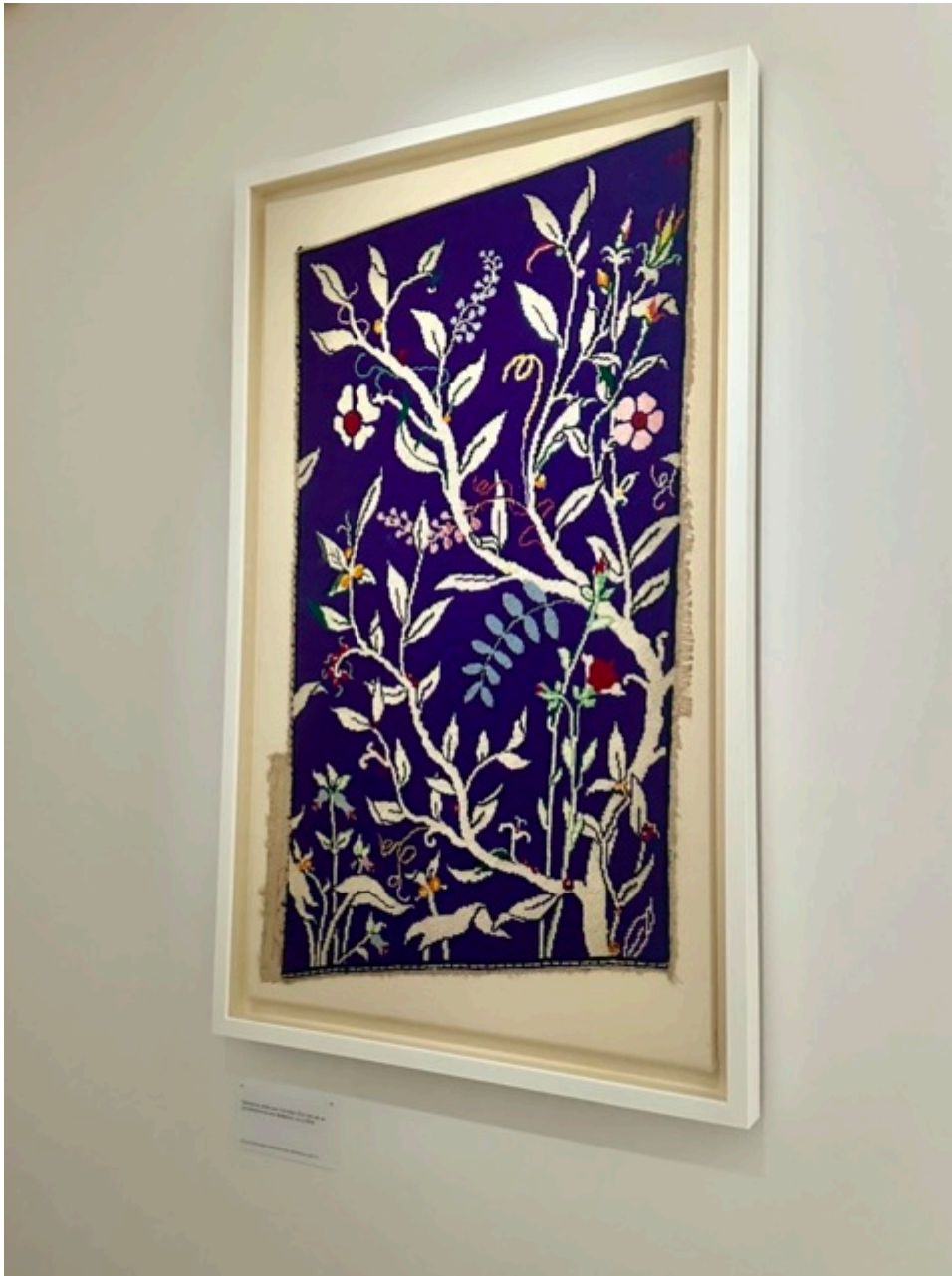
Une tapisserie faite par Christian Dior, jamais exposée auparavant

À l'étage, d'autres pièces remarquables emplies de détails, mais aussi une grande nouveauté cette année : des accessoires. Chaussures, bijoux, parfums sont aussi exposés, ainsi que des croquis de tenues élaborés par Christian Dior lui-même.