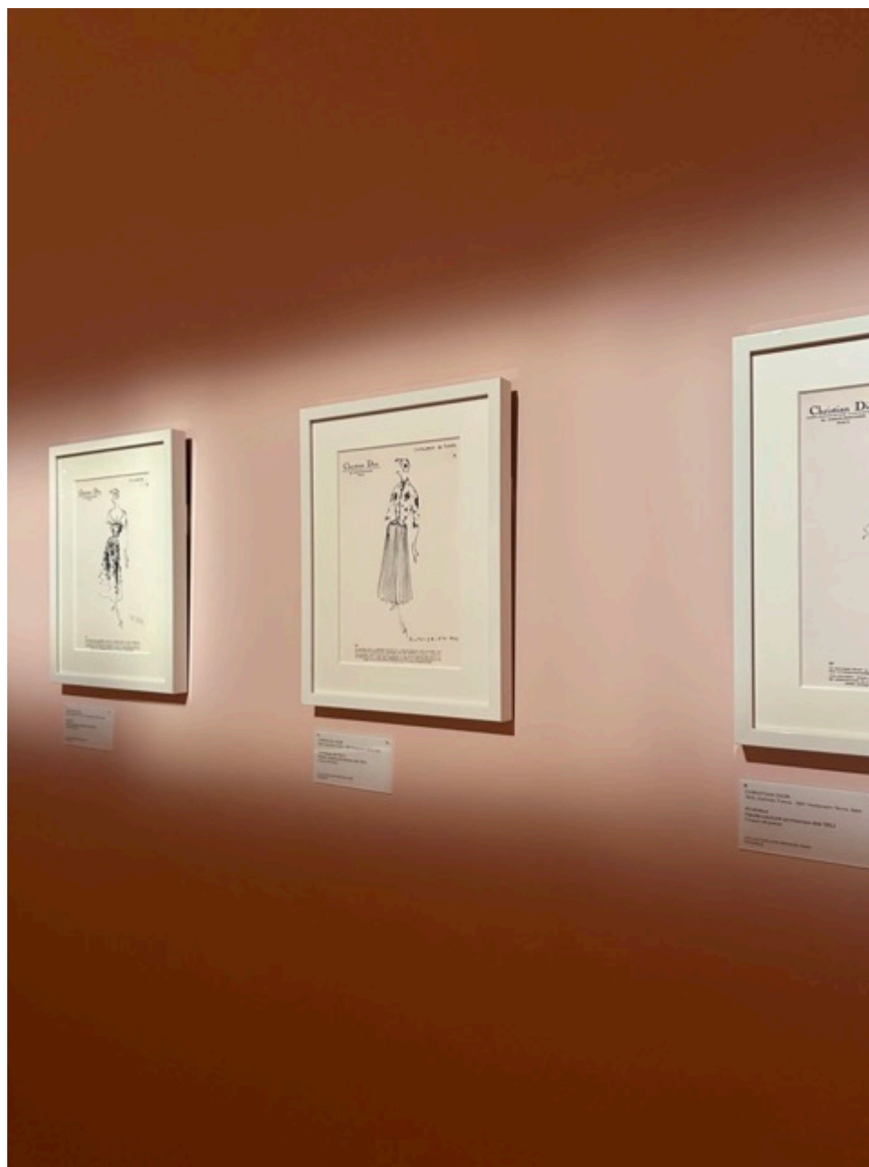
Des croquis de Christian Dior