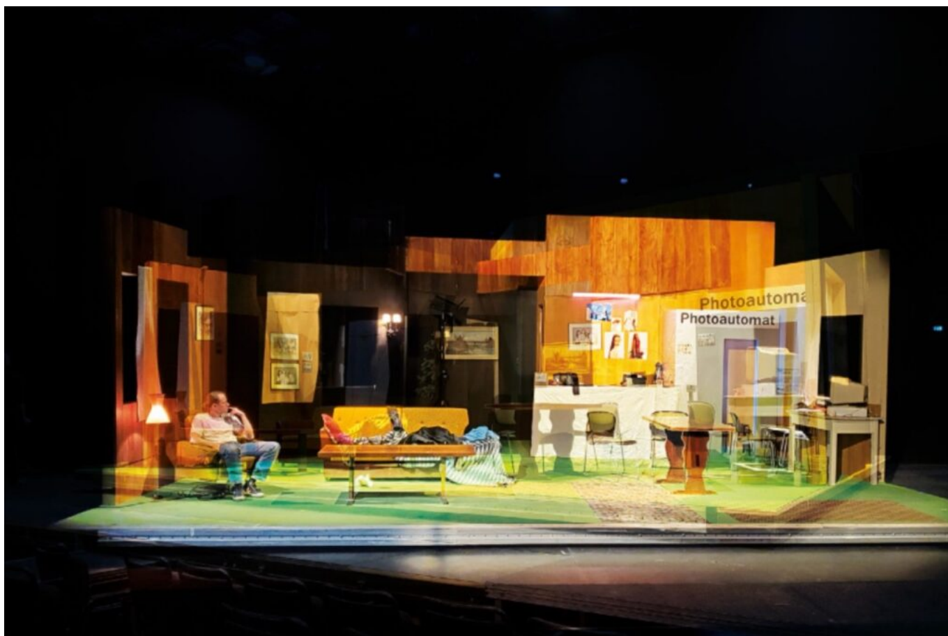
'Le Canard sauvage' d'Henrik Ibsen