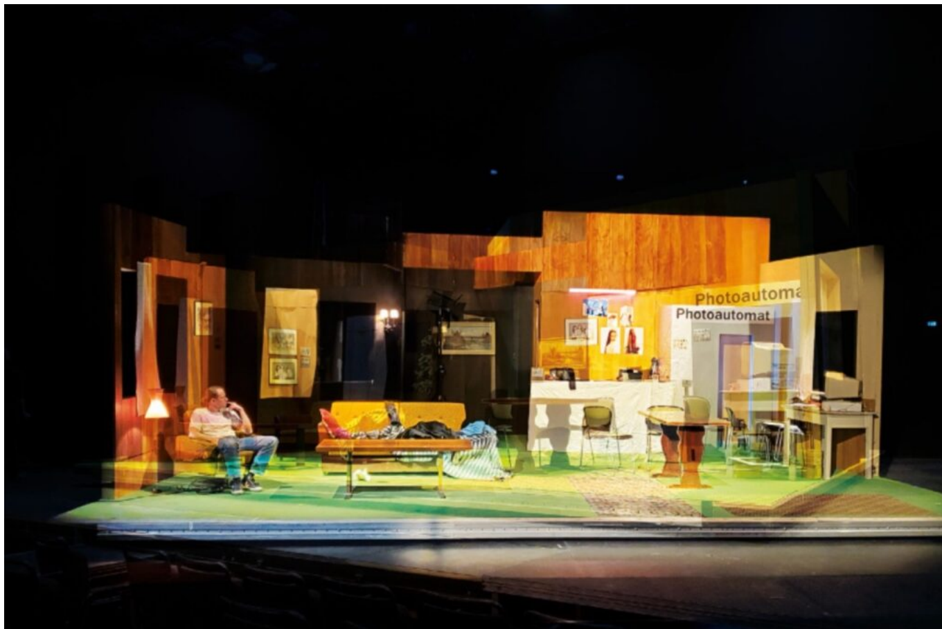
'Le Canard sauvage' d'Henrik Ibsen