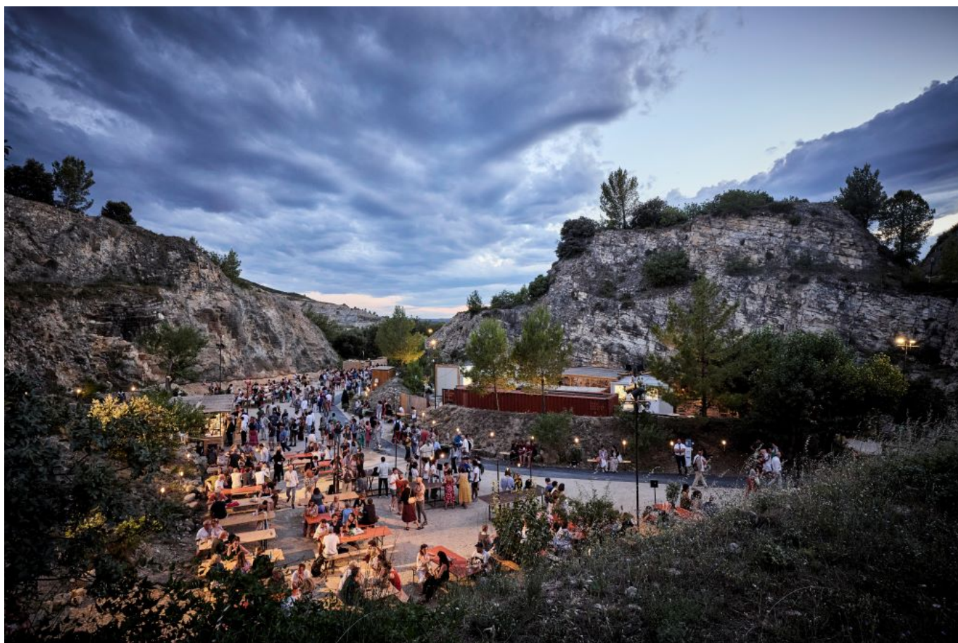
Les Carrières de Boulbon