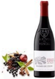
Les Banquettes (AOP Beauges-de-Venise)