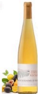
AOP Muscat de Beauges-de-Venise 2014