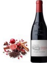
Les Jumelles (AOP Beauges-de-Venise)