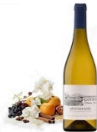
Premières Fleurs (IGP Méditerranée)