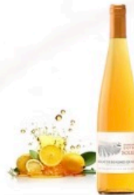
Solera (AOP Muscat de Beauges-de-Venise)