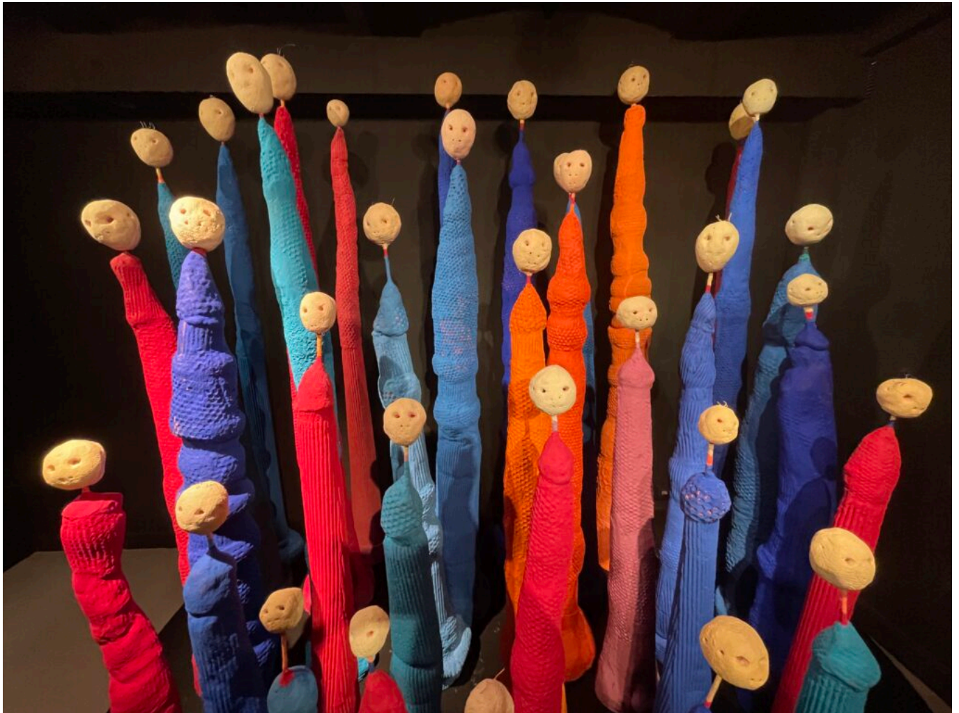
Œuvre de Mâkhi Xenakis, les folles d'enfer de la Salpêtrière Copyright MMH

Vendredis, samedis à 16h et dimanches à 11h.