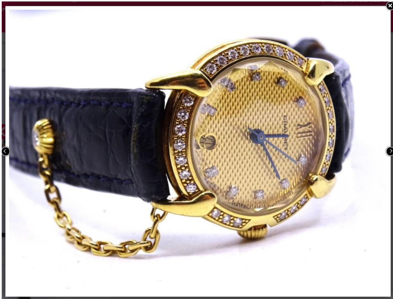
Montre Chaumet

Exposition vendredi 6 décembre de 10h à 12 et de 14h à 18h. Certains bijoux sur rendez-vous.