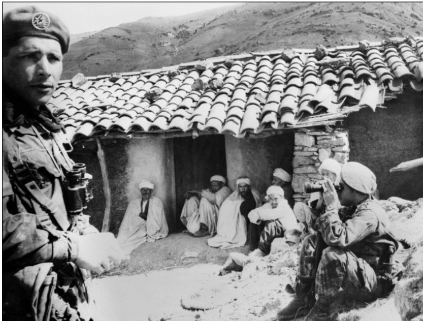
La guerre en Algérie