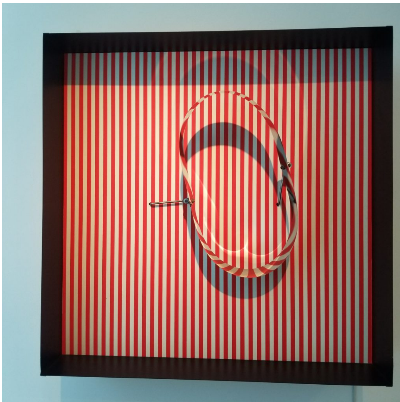
'Juste une illusion', art cinétique et optique

Ecrit par Mireille Hurlin le 21 juin 2021