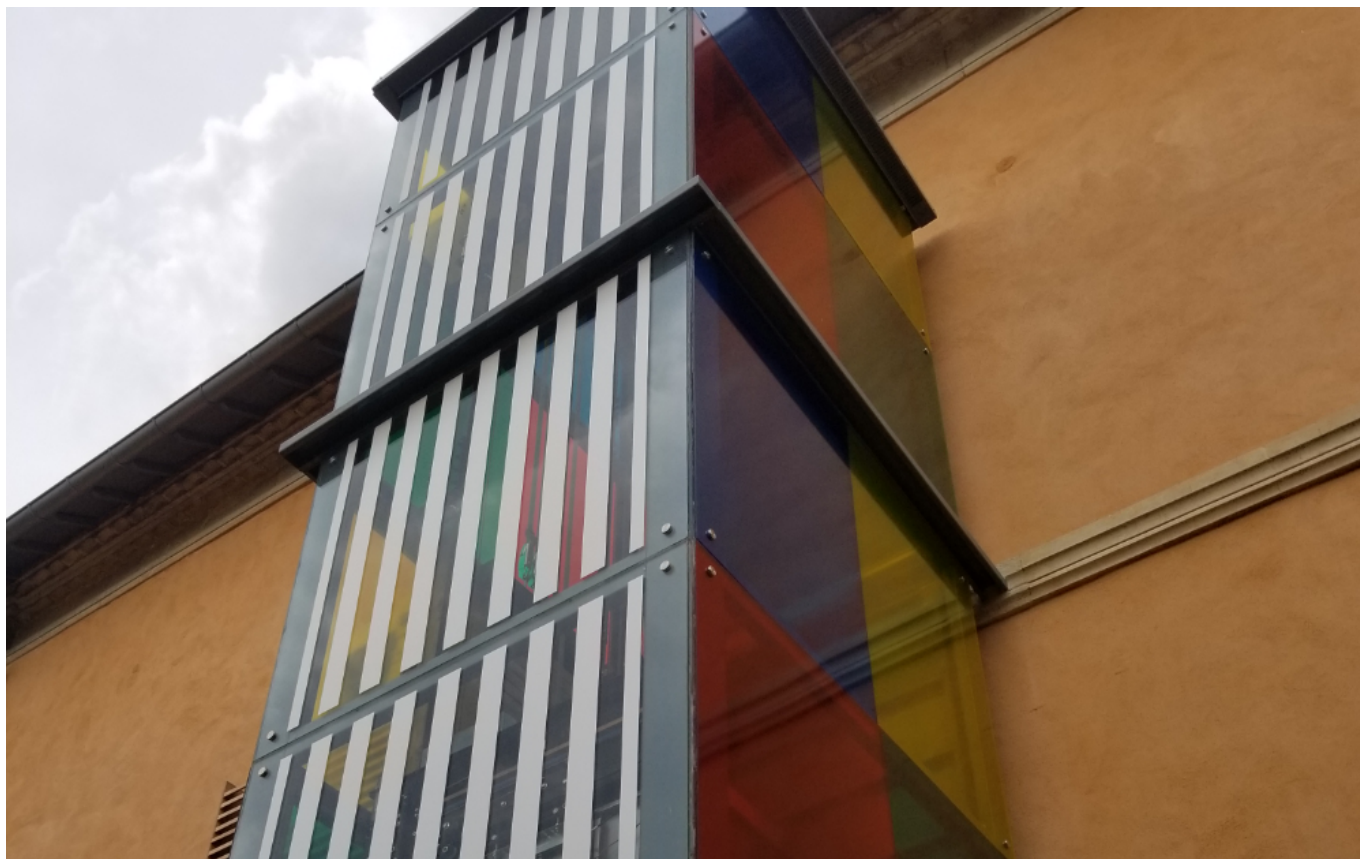
Sur le pignon de la Villa Datris, l'ascenseur habillé par Daniel Buren

4 000 salariés dans 25 sociétés a réalisé un chiffre d'affaires de 1,02 milliard d'euros en 2020 ; est en lien avec 1 million de clients ; possède 330 000m2 de stockage ; propose 200 000 produits et possède 14 centres de distribution.