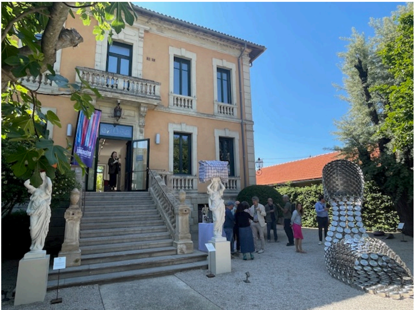
La Villa Datris

Une occasion de (re)découvrir l'exposition Engagées. Visites guidées en août vendredi et samedi à 16h et dimanche 11h. Entrée libre sur réservation. Durée 1h. Réservation ici . Entrée libre et gratuite. 7, avenue des quatre otages à l'Isle-sur-la-Sorgue. 04 90 95 23 70. info@fondationvilladatris.com