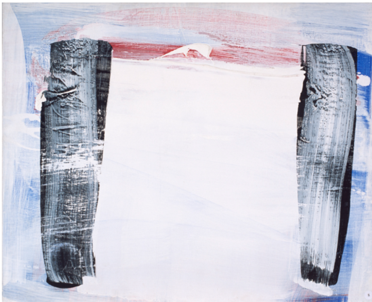
Œuvre de Claude Garanjoud

Ecrit par Mireille Hurlin le 14 juin 2024