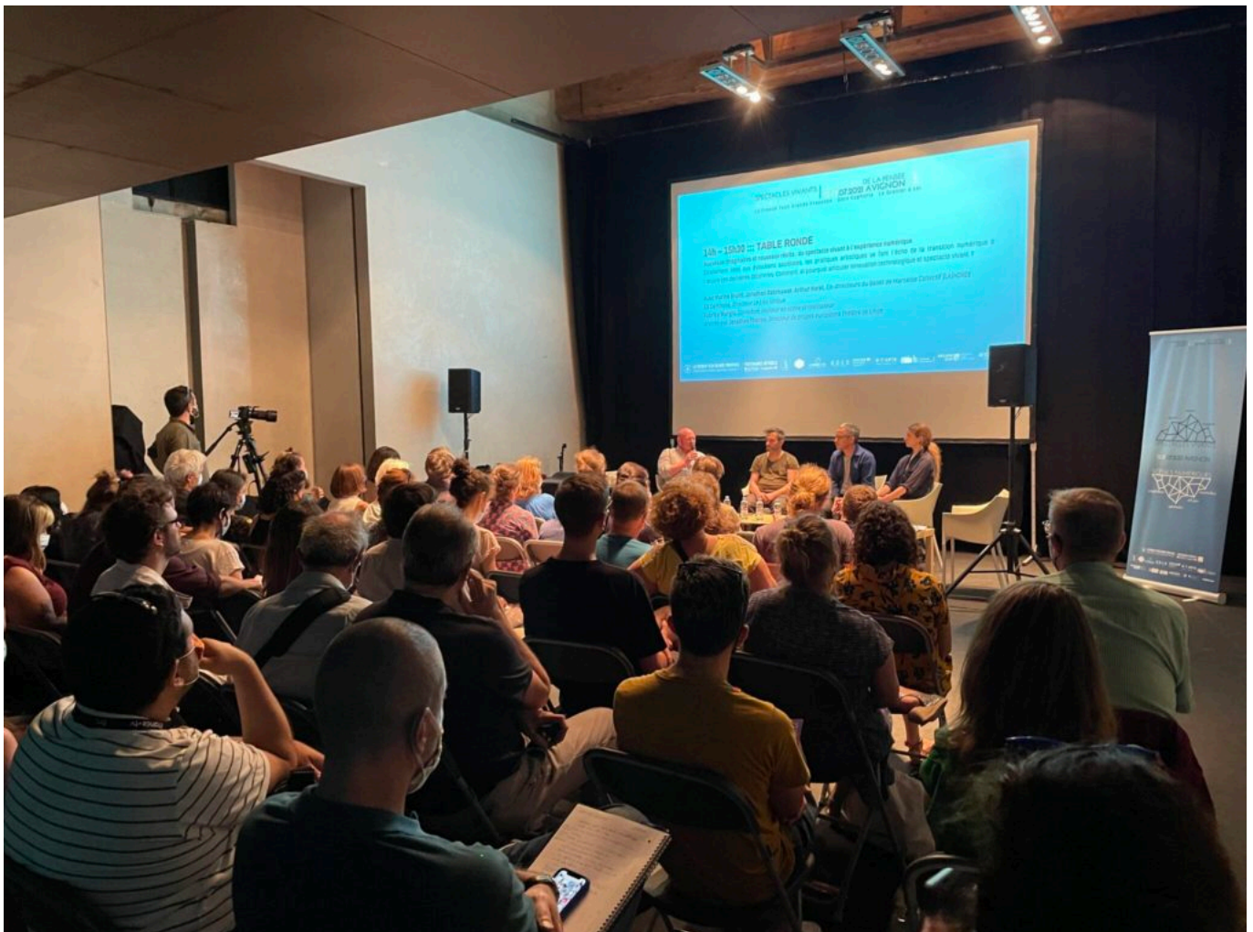
Carton plein pour les rencontres de la French Tech Grande Provence.