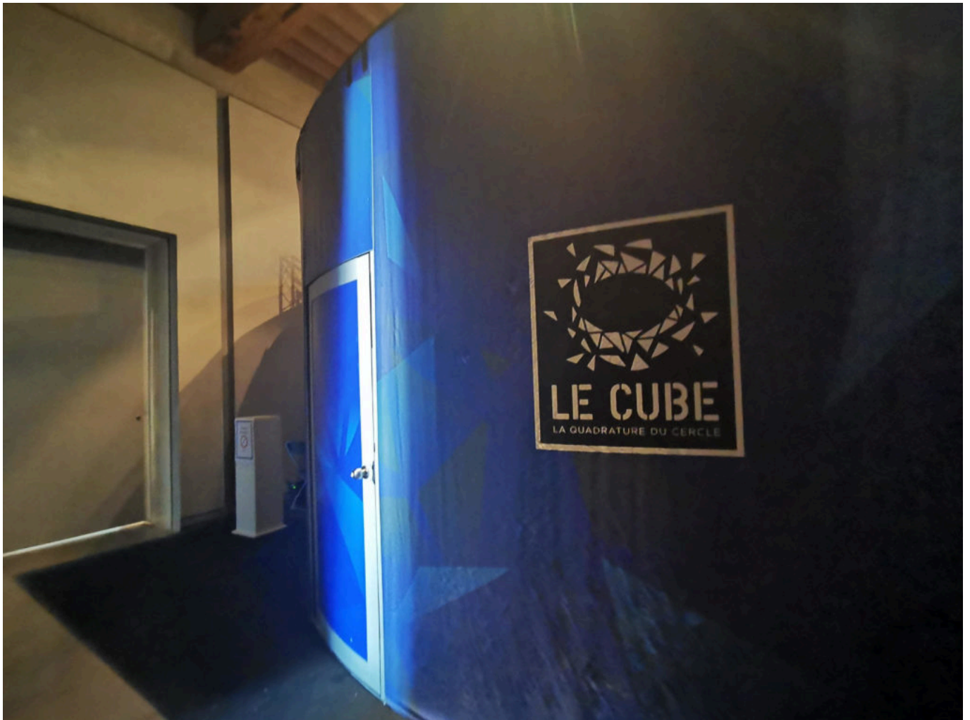
Le cube se dresse et vous appelle à l'évasion.

Ecrit par Linda Mansouri le 14 juillet 2021