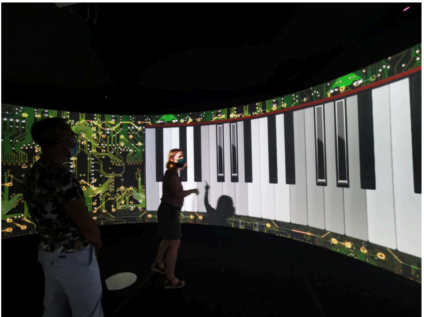
Dans le cylindre, la production vous emporte.