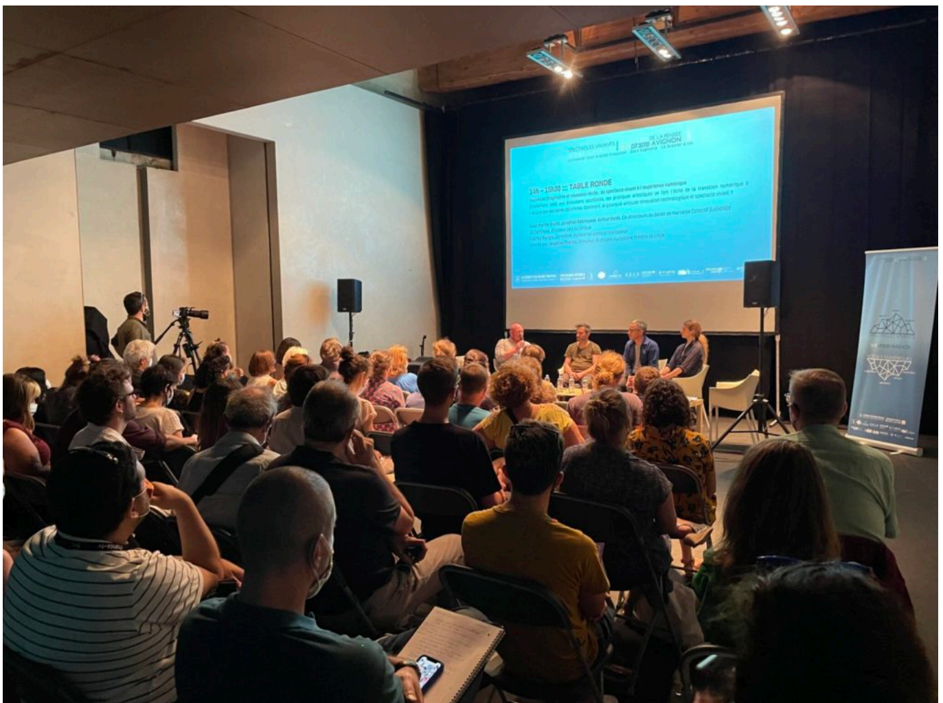
Carton plein pour les rencontres de la French Tech Grande Provence.