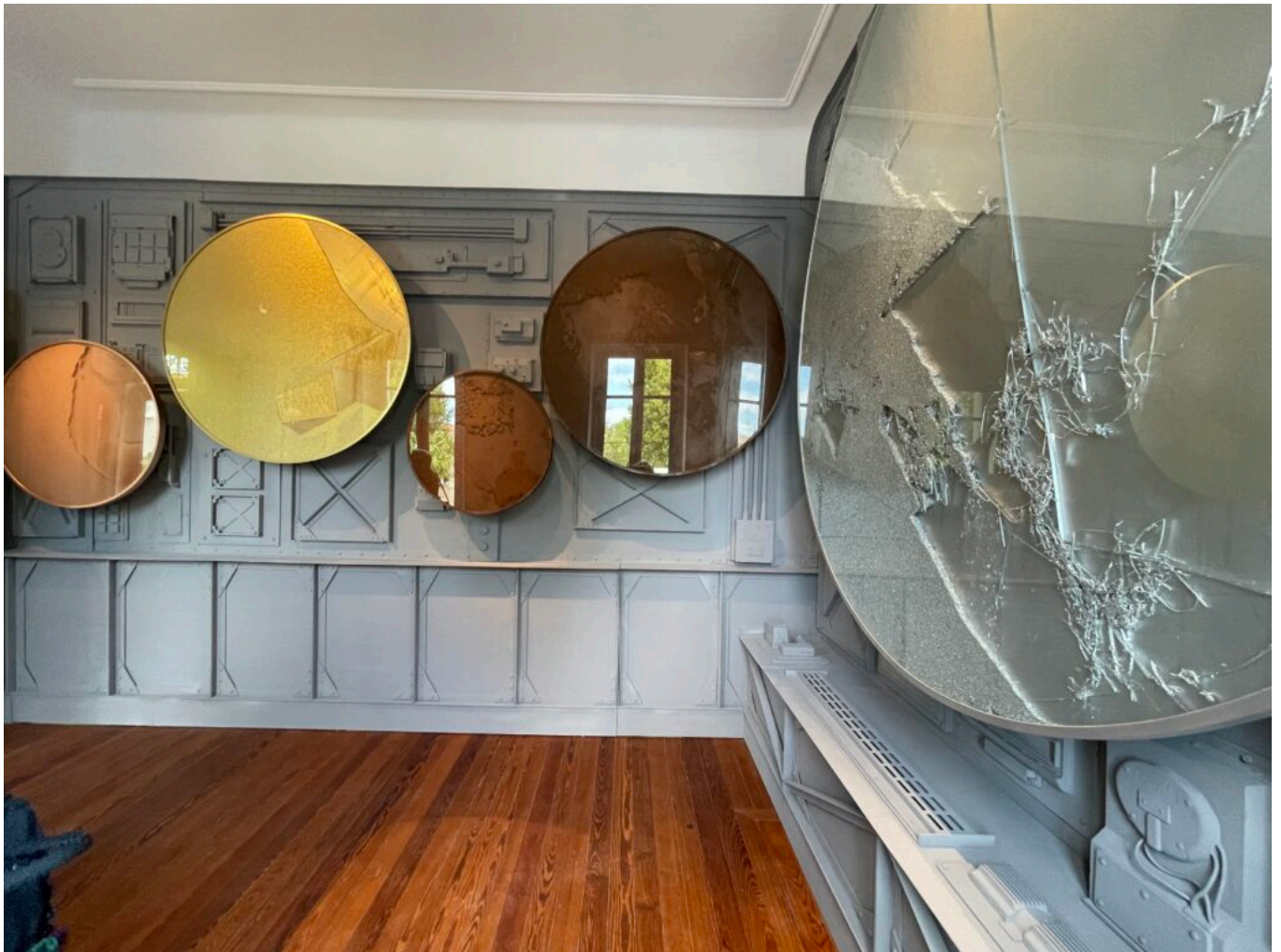
Matières métalliques de Manuel Merida, installation monumentale inédite, mouvement de matériaux dans 5 cercles, Copyright Mireille Hurlin

Ecrit par Mireille Hurlin le 12 juin 2023