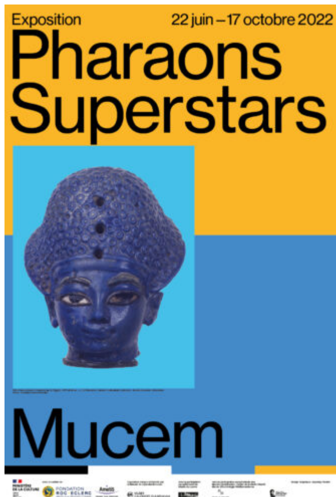
Affiche 'Pharaons Superstars'